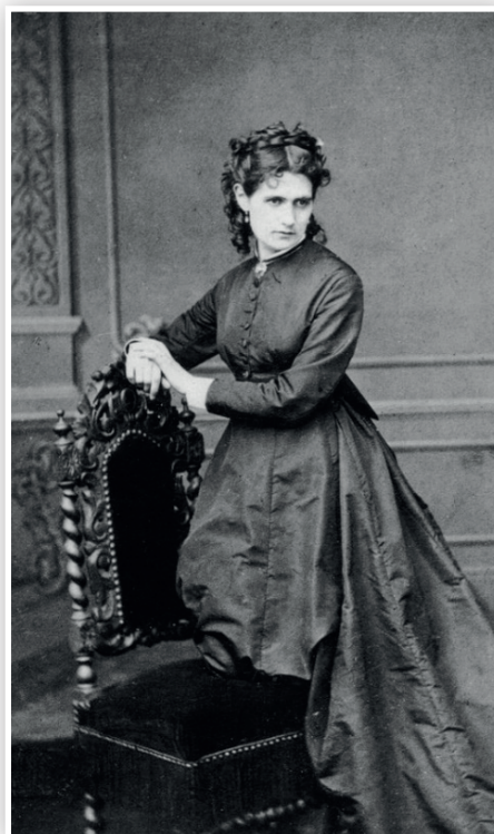
La pittrice francese Berthe Morisot (1841-1895)

Una figura di spicco in tal senso è la pittrice francese Berthe Morisot (1841-1895) , una delle protagoniste